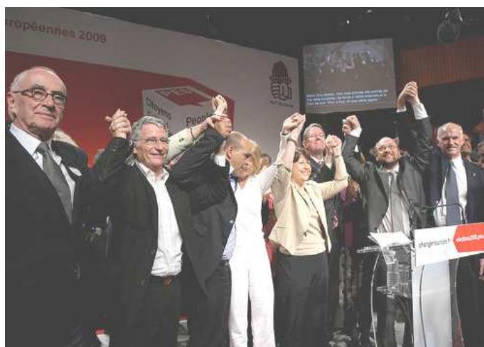
Main dans la main, les socialistes européens ont donné le coup d'envoi de la campagne le 24 avril dernier à Toulouse.