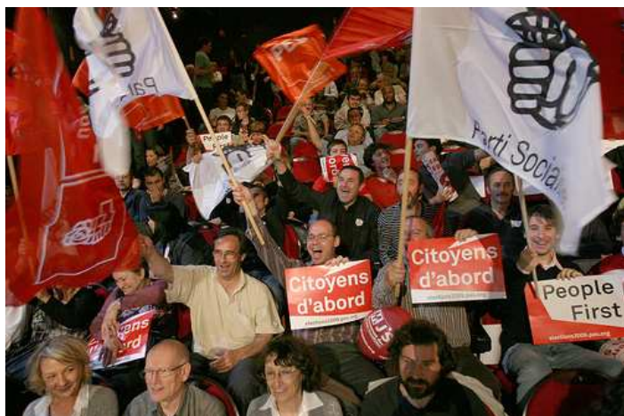
Salle comble et militants déterminés à faire barrage au duo Sarkozy-Barroso !

Les camarades gersois qui ont assisté le 24 avril à Toulouse au meeting de lancement de la campagne socialiste pour les élections européennes du 7 juin y ont puisé des raisons de se mobiliser pour voir l'Europe changer de visage en changeant la majorité au parlement européen.