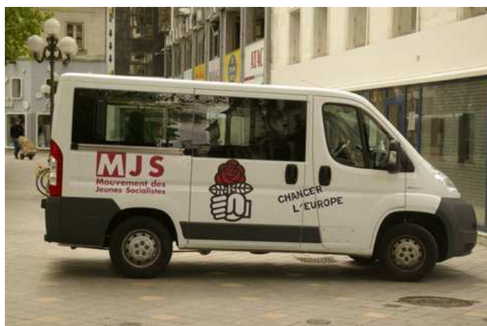
Les jeunes socialistes gersois s'engagent dans la campagne des européennes et comptent créer l'événement à bord de leur caravane militante !

Autre objectif affiché : «créer l'événement et gagner en visibilité en impliquant les militants socialistes».