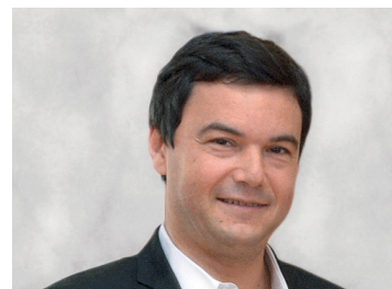
Thomas Piketty Économiste