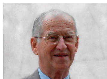
Éric de Montgolfier Procureur général honoraire