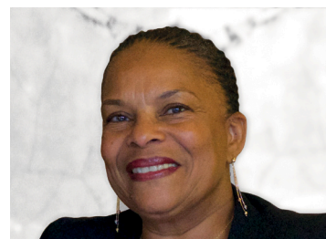
Christiane Taubira Ancienne garde des Sceaux